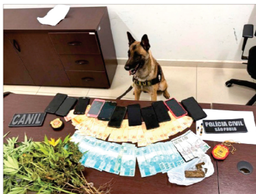
Operação envolveu 45 policiais civis, 43 policiais militares e 2 cães farejadores - Fotos: Divulgação/Polícia Civil.

A Delegacia de Investigações Gerais (DIG) e a Delegacia de Investigações Sobre Entorpecentes (Dise) de Catanduva, com o apoio operacional da Polícia Militar de Catanduva e do Baep de São José do Rio Preto, realizaram a "Operação Sentinela" na manhã desta quinta-feira, 20. O objetivo foi cumprir 23 mandados de busca e apreensão, de forma simultânea, nas cidades de Catanduva, Santa Adélia, Pindorama, Tabapuã, Ariranha, Palmares Paulista, Paraiso e Catigüí. Leia mais na página A3.