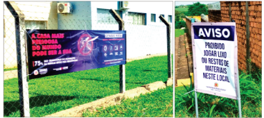
A luta contra a dengue exige a colaboração de toda a população